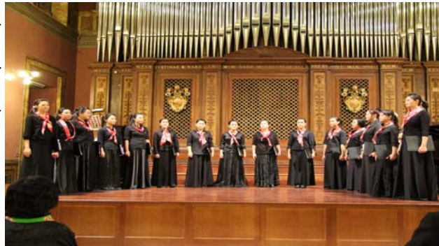
Chamber Choir of Fu-Jen Catholic University during its performance at the Academic Hall of the Pontifical Institute of Sacred Music.

Prima di introdurre il Coro al pubblico in sala, il Professor Tangari del Pontificio Istituto di Musica Sacra ha informato i presenti che il 2011 contrassegna anche il centesimo anniversario del suo Istituto, annunciando poi il programma musicale previsto per la serata: un mix di canti sacri più o meno celebri e pezzi tradizionali taiwanesi. Il Professor Tangari ha richiamato l'attenzione degli spettatori su due