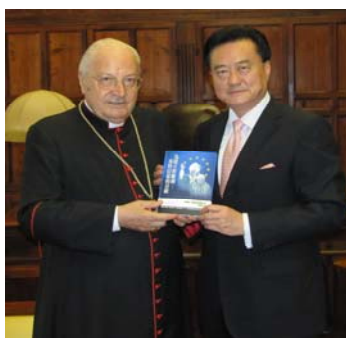
Ambassador Wang and Cardinal Sodano hold the first copy of the Mandarin version of the latter's book.

L'Ambasciatore Wang e il Cardinale Sodano mostrano la prima copia della versione in mandarino del libro del porporato.