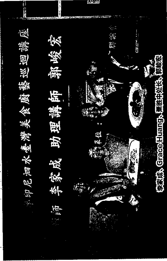
印尼泗水台湾美食厨艺巡回讲座