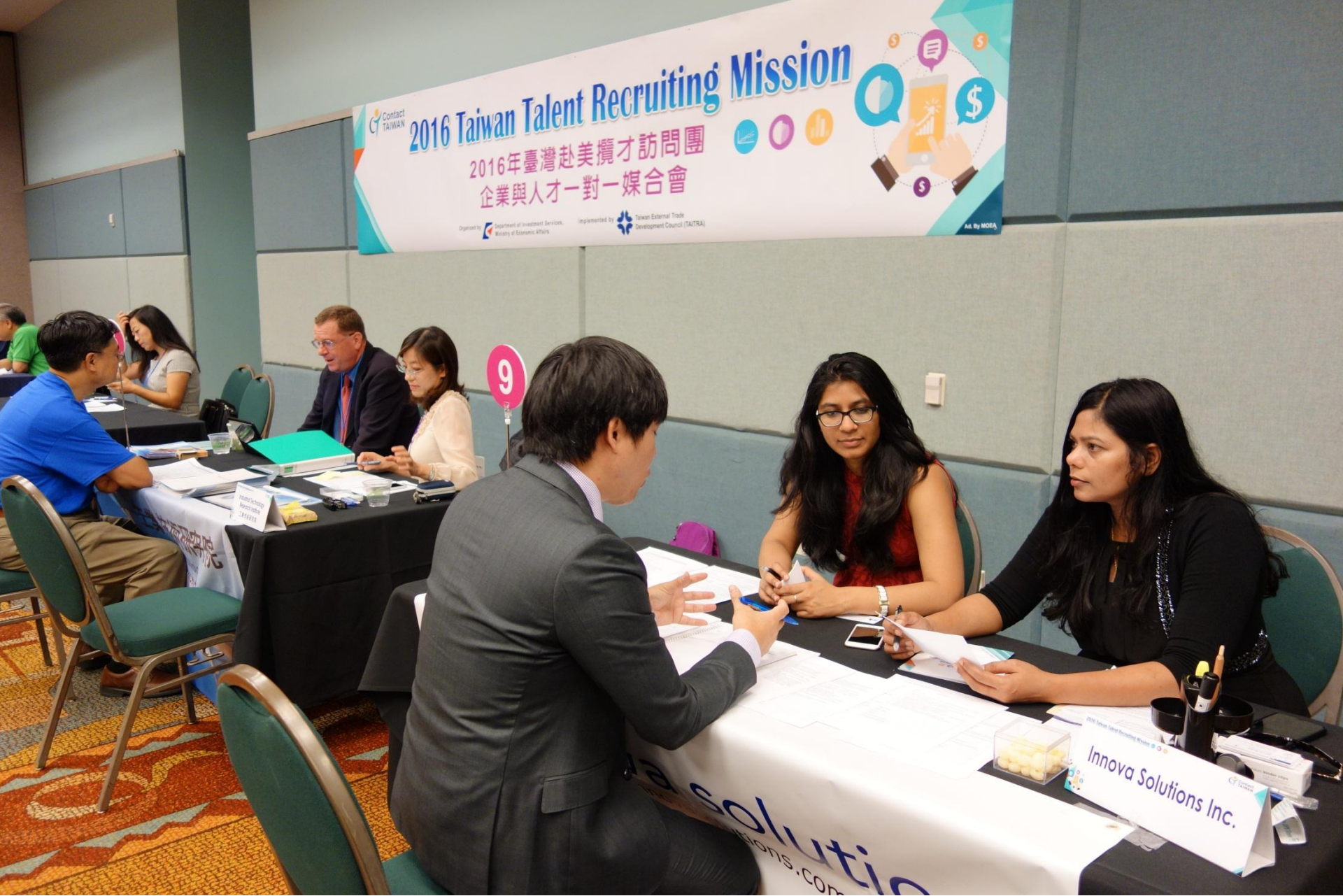
2016.9.24 矽谷企業與人才一對一媒合會 18