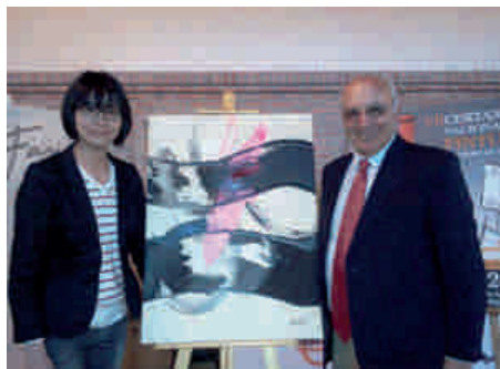
La artista junto al presidente de Bodegas Fariña

Bodegas Fariña organizará una exposición