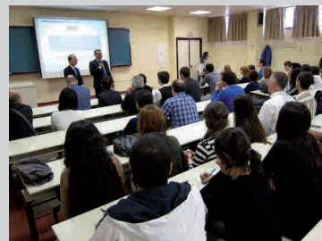
Conferencia en la Universidad de Sevilla

En el festival han participado estudiantes de las ocho universidades de diseño de moda más prestigiosas del mundo: Parsons (Nueva York), The Royal Danish Academy School of Arts (Copenhague), ESMOD (Berlín), el Instituto Marangoni de Milán, la Universidad de Buenos Aires, la Jannette Klein de México y la ESNE de Madrid, además de la mencionada Shih Chien de Taiwán.