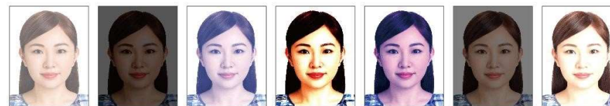
太亮 太暗 對比不足褪色 對比太強 皮膚色調不自然 曝光不足 曝光過度