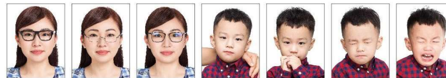
配戴粗框眼鏡 鏡框遮蔽到眼睛 鏡片反光 非獨照，出現其他人、物影像 嘴巴被手遮蔽 閉眼睛 表情不自然、哭泣