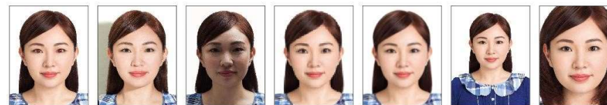
紅眼 背景有陰影 臉部陰影 解析度過低 模糊、對焦不正確 頭部比例過小 頭部過大，頭髮碰觸邊框