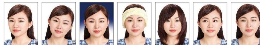
頭部側向一邊、未正視鏡頭 頭部傾斜不正 背景色彩非白色 臉部及雙耳被物品遮蔽 頭髮遮蔽到眼睛或耳朵 眼睛未正視鏡頭 使用有色隱形眼鏡