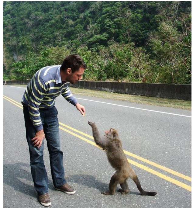
(柯天健在花蓮)