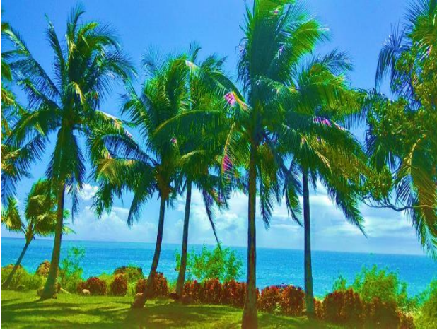
(南臺灣墾丁風景)

我住在臺灣的經驗與我來臺灣之前的預期完全不同。臺灣多元文化結合亞洲、原住民及西方的文化、傳統以及信仰。台灣有許多美麗的地方，除了台北外，高雄海港、台南古城、詩情畫意九份、如同夏威夷風光的東部海岸、約 4 千米高的中央山脈以及晴朗的墾丁，都是臺灣的驕傲。