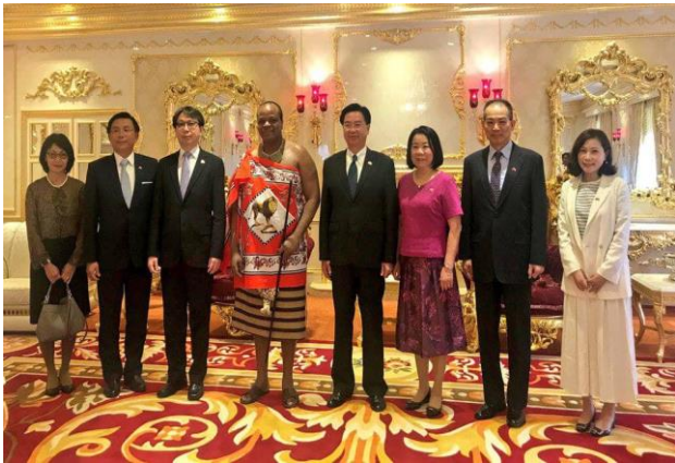
(外交部長吳釗燮以總統特使身分率團訪問友邦史瓦帝尼王國出席國王恩史瓦帝三世 51 歲壽誕慶典活動)