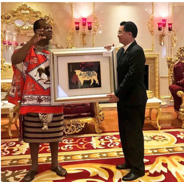
(外交部長吳釗燮以總統特使身分率團訪問友邦史瓦帝尼王國出席國王恩史瓦帝三世 51 歲壽誕慶典活動)

外交部長吳釗燮以總統特使身分，應邀偕夫人率團一行 5 人於本(108)年 4 月 24 日至 28 日赴非洲友邦史瓦帝尼王國出席國王恩史瓦帝三世(H.M. King Mswati III) 51 歲壽誕慶典活動。