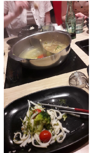
Abbildung5 Hot Pot