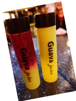
Abbildung3 Guava Smoothie