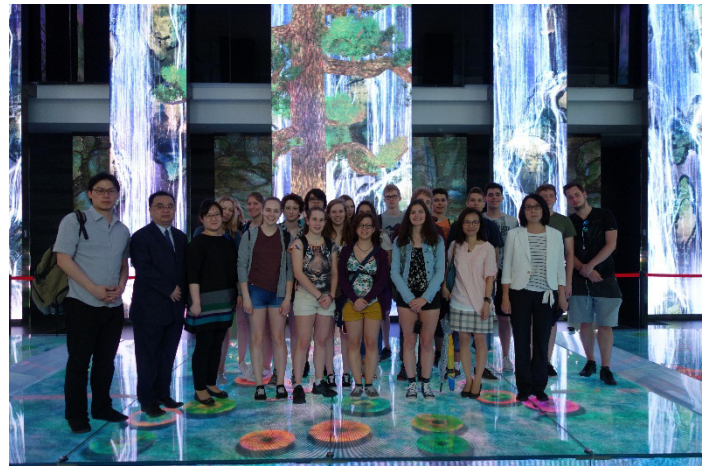
Abbildung6 CTBC Financial Bank

Zu den Unternehmen zählten: WKO, CB –Ceratizit (stellt Werkzeuge aus Wolfram her) und die CTBC Financial Bank, die eine riesengroße, modern ausgestattete Bank ist – sie stellt sogar einen Fitnessraum, Massage und vieles mehr für ihre Angestellten zur Verfügung.