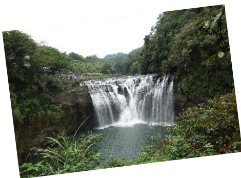
Abbildung10 Wasserfall in Jifen