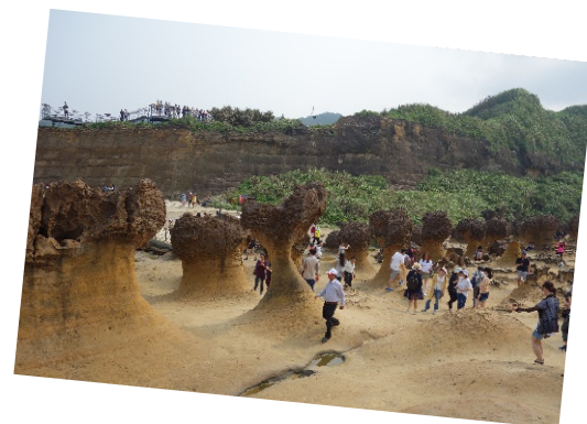
Abbildung11 Strand Yehliu