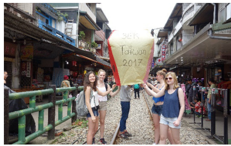
Abbildung 9 Sky Lantern steigen lassen in Jifen