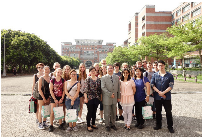
Abbildung8 Kainan University