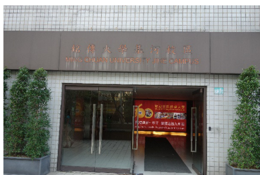
Abbildung1 Ming Chuan University