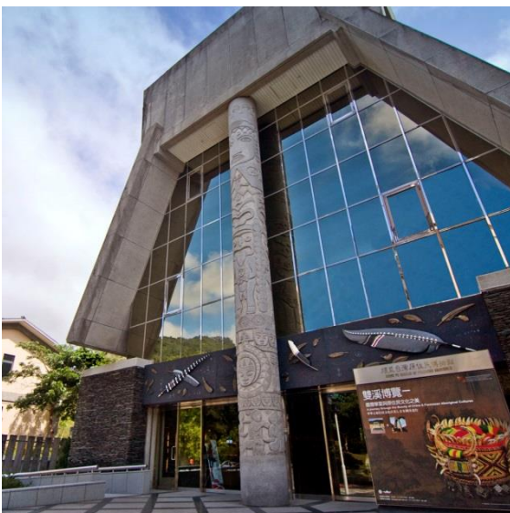
Das Shung Ye Museum

Als Erinnerung an diese Reise durch die Welt der taiwanesischen Aborigines können Besuchergruppen auf dem 4. Stock aus verschiedenen traditionellen Materialien und Motiven selbst DIY-Souvenirs basteln.