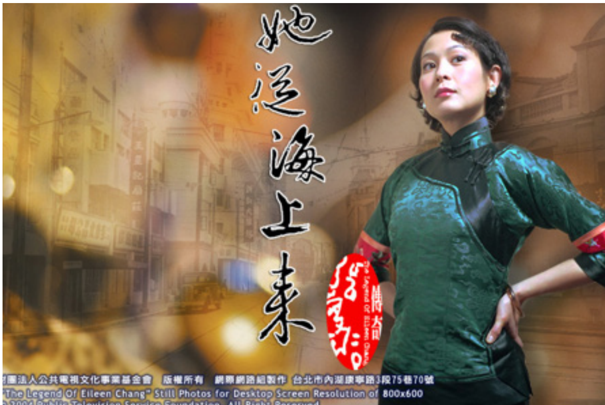
Eileen Chang legendája

li életét. A 2000-ben TV-re került „Áprilisi Rapszódia” hatalmas sikert aratott, és az egyik legtöbbet tárgyalt sorozattá vált abban az évben. Felhívta a közönség figyelmét Xi irodalmi munkáira és romantikus életére, megdöntve a nézettségi és értékelési rekordokat a Köztelevíziós Rendszerénél. Az „Eileen Chang legendája”, Wang következő forgatókönyve szintén kemény munka és kutatás eredménye volt. Hogy hűen ábrázolhassa