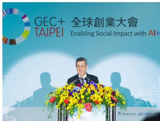
Chen Chien-jen alelnök beszédet mondott a Globális Vállalkozói Kongresszus megnyitó ünnepségén szeptember 27-én Tajpejben.

infrastruktúra és a digitális gazdasági innovációkat a társadalmi jószág eszközeként használják, tette hozzá Christensen. A kongresszus a Taiwan Innotech Expo-val együtt folyt, ami Ázsia egyik legnagyobb tech kereskedelmi show-ja. Az első részét 2016-ban tartották a dél-koreai Daegu-ban, majd a dél-afrikai Fokvárosban és a thaiföldi Bangkokban is tartottak kapcsolódó eseményeken a tavalyi évben.