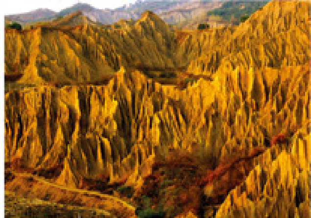
Balra: a Tizennyolc Arhat hegység / Jobbra: "Holdvilág" természetlen vidék

A Cijin-sziget és a belváros között található Kaohsiung kikötője, mely világ színvonalú és a nemzetközi kereskedelem központja Tajvanon. A hajók és konténerek folyamatos érkezése a világ minden tájáról jelképezi Kaohsiung üzletének energiáját és vitalitását. Kaohsiung, a gyógyás városa nem csak olyan különlegességekkel rendelkezik, mint a hegyek, tenger, folyó és kikötő, de gazdag kultúrával és gyönyörű városképpel is.