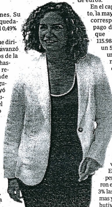
María Jesús Montero, ministra de Hacienda

En el capítulo de gastos, la mayor partida se corresponde con el pago de pensiones, que absorbió 115.984,48 millones, un 5,4% más que un año antes. El mayor número de prestaciones, unido a que las nóminas son cada vez más elevadas explican unos gastos, que se mantienen al alza debido también a su revalorización. Este año las pensiones crecieron en un 1,6% y un 3% las rentas mínimas y las no contributivas.