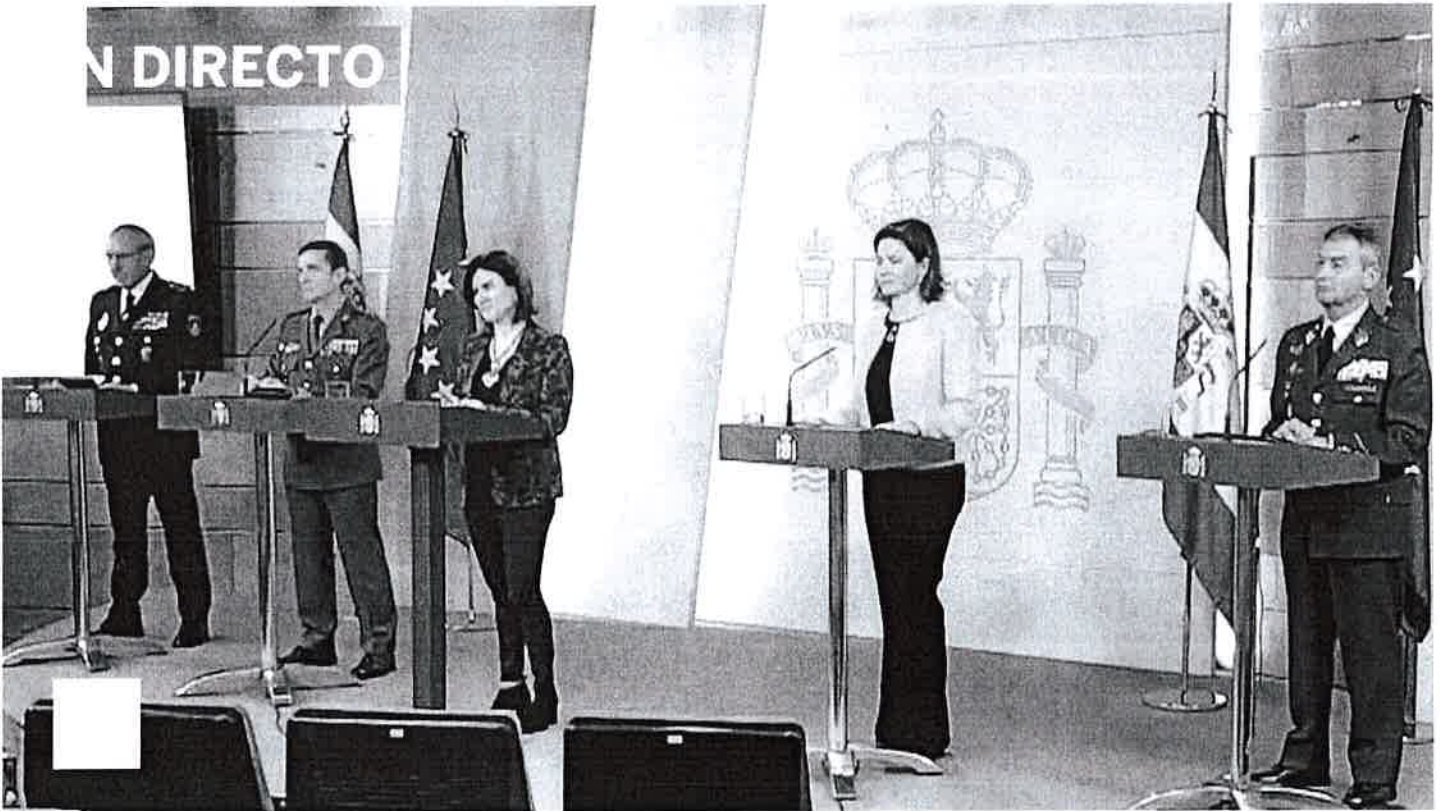
Coverage en directo de la conferencia de prensa del Gobierno sobre el avance de la gestión del coronavirus.

España registra 8.189 fallecidos, más de 94.000 contagiados, 50.000 hospitalizados y casi 20.000 recuperados desde el inicio de la crisis | El Gobierno prevé aprobar ayudas al alquiler y una moratoria de cuotas a autónomos y pymes | EE UU supera los 3.000 fallecidos y Nueva York se prepara para un "tsunami" de contagios