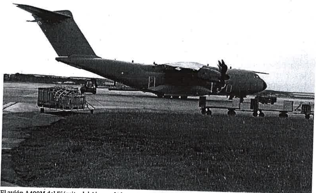
El avión A400M del Ejército del Aire, en la base de Torrejón de Ardoz (Madrid)

El Ejército acudirá en ayuda del Ayuntamiento de San Cugat del Vallés (Barcelona), institución que en las últimas horas solicitó al Ministerio de Defensa la presencia de los militares para luchar contra el Covid-19. Se da la circunstancia de que San Cugat es el primer municipio con un alcalde de ERC que pide ayuda al Ejército. Con este ya van 27 los municipios catalanes que han solicitado ayuda militar. Además, ayer, el «macroalbergue» de la Fira de Barcelona recibió otras 225 camas del Ejército y Margarita Robles anunció que se dará apoyo al hospital de Sabadell.