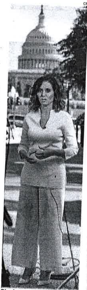
Díaz Ayuso, en EE UU

En sus declaraciones a la prensa tras su encuentro, Ayuso aseguró haber trasladado sobre todo preguntas sobre su conocimiento de Madrid, pero también lanzó el debate sobre el porqué los españoles se tienen que cuestionar ahora su legado en el continente americano. Por qué ahora se está haciendo una revisión sobre la historia de España y el legado de nuestro país en España. Cree que «este comunismo que se basa en crear agravios no está generando beneficios», dijo.