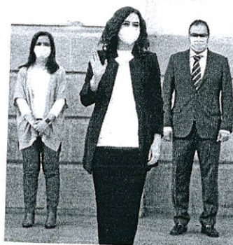
Isabel Díaz Ayuso

Ayuso insistió en la necesidad de que la región avance y comience a recuperar parcialmente su actividad económica, de nuevo en torno a la idea de que el confinamiento no puede alargarse «eternamente». A su juicio, una semana más o menos es clave para la viabilidad de las empresas.