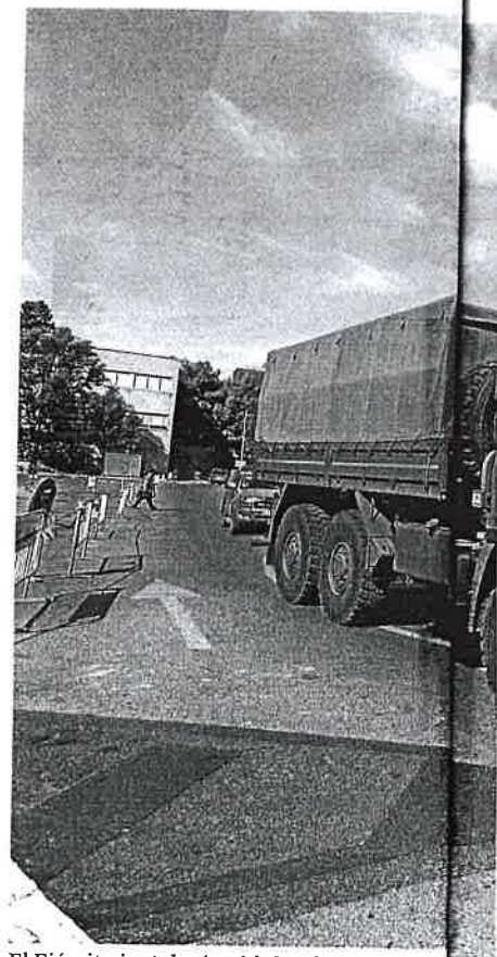
El Ejército instalará módulos de triaje en el Clínico de Zaragoza