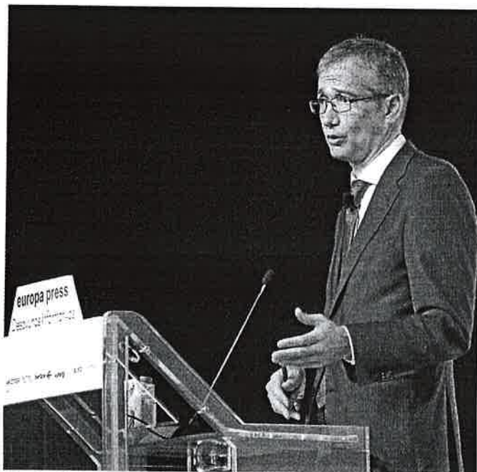
El gobernador Hernández de Cos, ayer en un acto de Europa Press

No obstante, pese a los fondos europeos, las reformas tendrán que llegar, y, mientras tanto, las ayudas directas deben ejecutarse de forma «rápida y homogénea». Así lo advirtió ayer el gobernador del Banco de España, Pa-