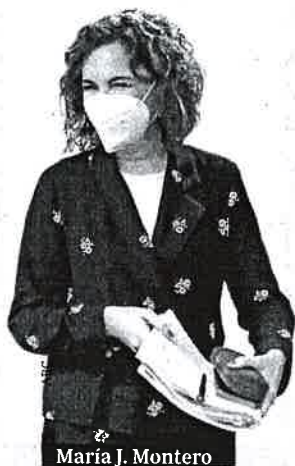
María J. Montero

Montero señaló que «habrá modificaciones» en el plan de ayudas a pymes y autónomos al tramitarlo como proyecto de ley, en referencia a incluir a más sectores de actividad, tras las críticas de ATA.