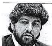
FERNANDO LÓPEZ MIRAS

↓ El ex presidente de la Generalitat, en otra muestra de su demagogia y cinismo, criticó en un tuit que se vacune a los agentes de la Policía y la Guardia Civil «antes que a personas indefensas a las cuales golpearon». La Generalitat, tal como ha resuelto la Justicia, está discriminando a ambos cuerpos.