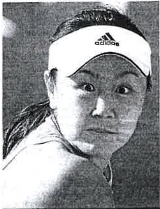
Peng Shuai Tenista

El Ministerio de Consumo es el único de los veintidós del Gobierno de Sánchez que no ha presentado un solo proyecto a los fondos europeos Next Generation. Ni uno redactó el año pasado y parece que esa larga siesta le durará todo el primer semestre de 2022. El intentar dañar sectores punteros de la economía (turismo o ganadería) u organizar huelgas de juguetes le debe de tener tan entretenido que no halla un minuto para dar alguna utilidad a su ministerio 'florero'. Aunque viendo cómo piensa quizás esa holgazanería sea una bendición.