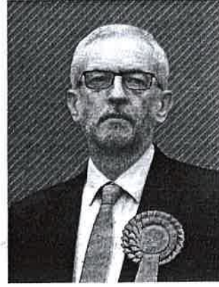
Jeremy Corbyn Exlíder laborista británico