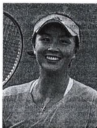
Peng Shuai.