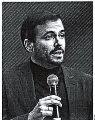
Alberto Garzón Ministro de Consumo