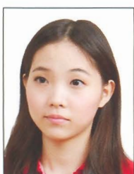
頭部側向 一邊、未 正視鏡頭