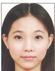
頭髮碰觸到 照片邊框