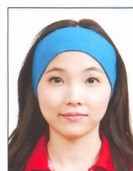
臉部及雙 耳被物品 遮蔽