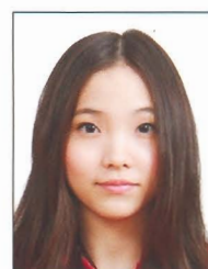
頭髮遮蔽 到眼睛或 耳朵