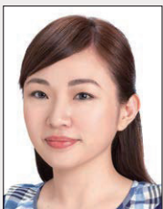
頭部側向一邊、 未正視鏡頭