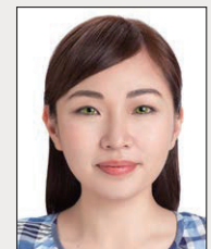
使用有色 隱形眼鏡