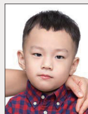
非獨照，出現 其他人、物影像