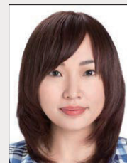
頭髮遮蔽到 眉、眼或耳朵