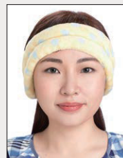
臉部及雙耳 被物品遮蔽