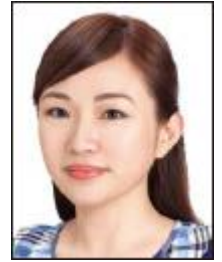
正面を 向いていない