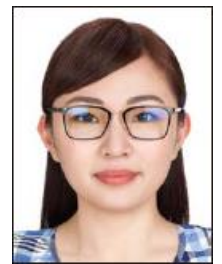
眼鏡のレンズが 反射している