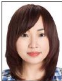
髪で眉毛や耳が 隠れている