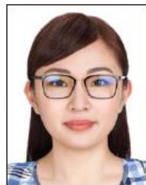
眼鏡のレンズが 反射している