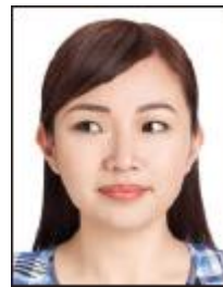
正面を 見ていない