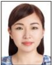
カラコンを装着している