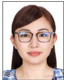
眼鏡のレンズが反射している