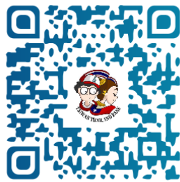
Taiwan Thailand Fans